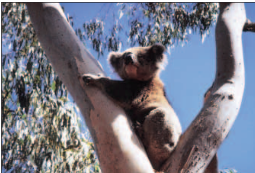
... a důvod naší návštěvy Mt Eccles N. P.: Koala.