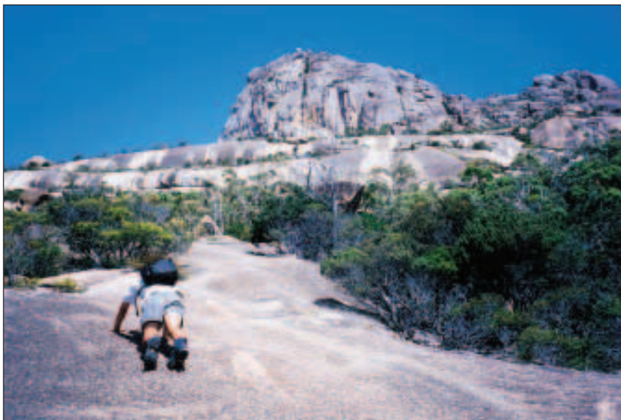
Výstup na Mt. Amos